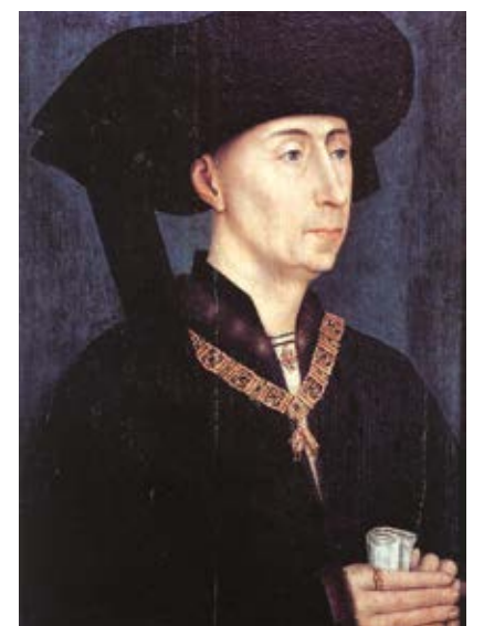
Philippe Le Bon, Duc de Bourgogne Le « bon oncle » de Louis XI

En 1457, Louis eut la satisfaction de voir arriver sa femme, Charlotte de Savoie, qu'il avait épousée contre l'avis de son père. Le 17 juillet 1459, à Genappe, la dauphine mit au monde un fils que l'on appela Joachim.