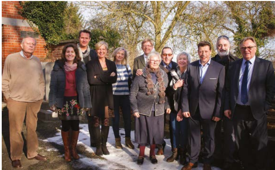
Photo: Les anciens conseillers du CPAS