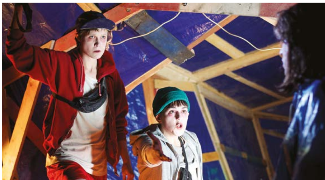
Le spectacle «Gulfstream»

En marge de ces représentations, des ateliers philosophiques, animés par le Pôle Philo de la Laïcité Brabant wallon, sont également proposés aux classes qui le souhaitent. Une occasion de réfléchir, de s'étonner, de parler du spectacle et des préoccupations des enfants ainsi que de donner du sens, par eux-mêmes, à ce qu'ils ont vu.