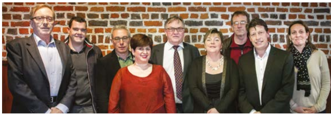
Le Conseil du CPAS

Le CPAS a réalisé des efforts importants dans les dépenses de personnel et de transfert. Des économies dans les dépenses de fonctionnement ont été menées mais ne pourront plus faire l'objet de réductions lors des prochains exercices. Il faut préciser que la subvention communale de 1.398.750 euros ne fait l'objet d'aucune augmentation et permet de conserver une action globale répondant aux besoins sociaux de la population de la Ville de Genappe. Il faut préciser également que le budget extraordinaire est financé principalement par fonds propres. Sans augmentation de la part communale, le CPAS investit dans la pérennité d'une série de nouveaux projets censés répondre à l'évolution des besoins sociaux dans notre région tout en augmentant le volume de l'emploi. Le CPAS se veut être une institution dynamique au service de la population et attentive à l'émancipation des citoyens les plus fragiles de la Ville de Genappe et de ses villages.