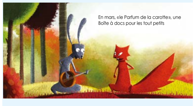
En mars, «le Parfum de la carotte», une Boîte à docs pour les tout petits