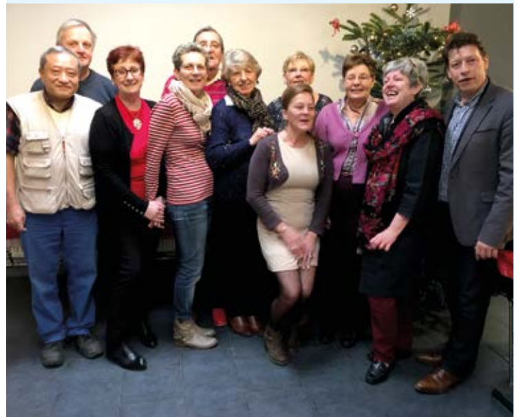
Les bénévoles du P'tit Resto de Genappe à l'occasion du repas de Noël ont reçu la chorale de Vieux-Genappe!