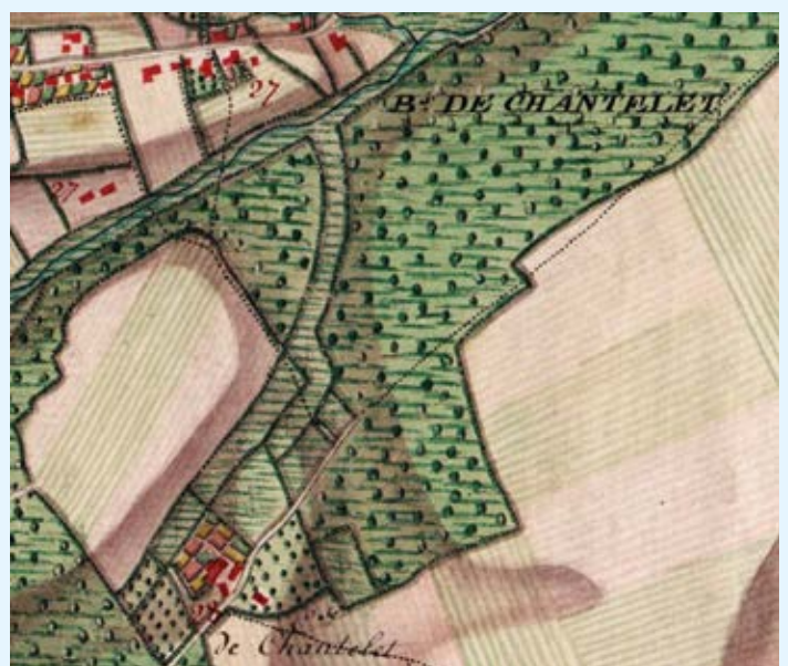
La chapelle du Chantelet et son domaine à Vieux-Genappe

Riquet A., Letroye J. & Piermarini S., 2015. (Documents, 9)