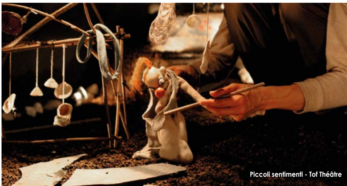
Piccoli sentimenti - ToF Théâtre