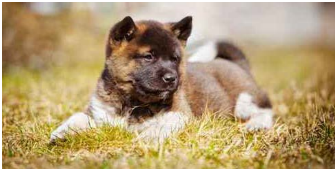
L' Akita Inu très mignon petit, est en réalité un chien de combat d'origine japonaise

Si vous n'avez pas de chat et que vous aimeriez en adopter, passez par un refuge. Beaucoup de chats y attendent une bonne famille et ils sont déjà stérilisés!