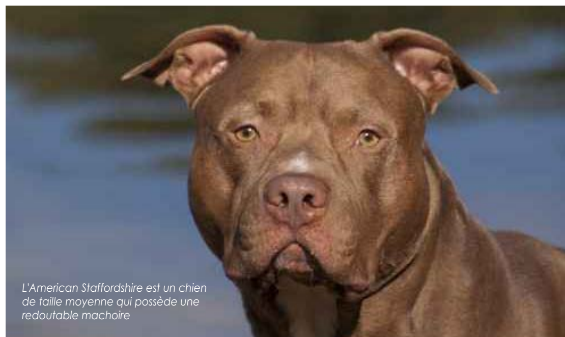
L'American Staffordshire est un chien de taille moyenne qui possède une redoutable mâchoire